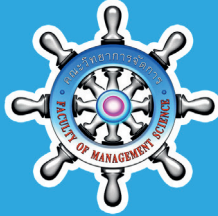
คณะวิทยาการจัดการ