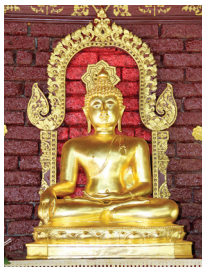
พระพุทธรูปประจำมหาวิทยาลัยราชภัฏลำปาง