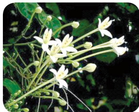
ดอกไม้ประจำมหาวิทยาลัยราชภัฏลำปาง ดอกกาสะลอง