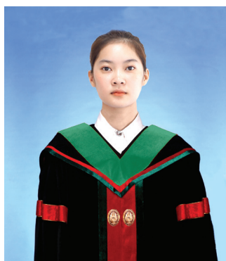
วิศวกรรมศาสตรบัณฑิต (วศ.บ.) สีเขียว