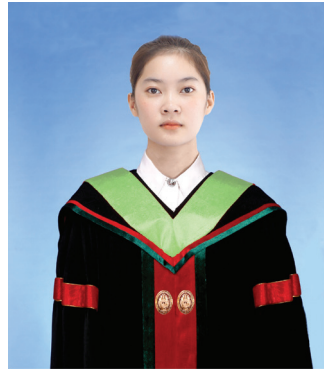
การจัดการบัณฑิต (กจ.บ) สีเขียวอ่อน