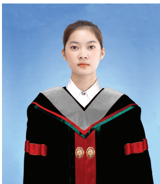
รัฐประศาสนศาสตรบัณฑิต (รป.บ.) สีเทา