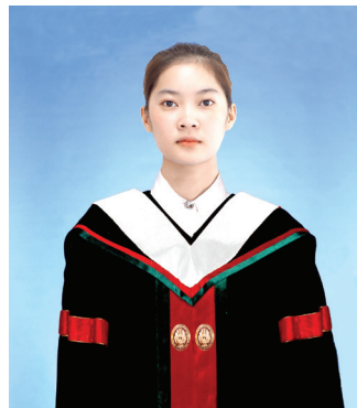
นิติศาสตรบัณฑิต (น.บ.) สีขาว