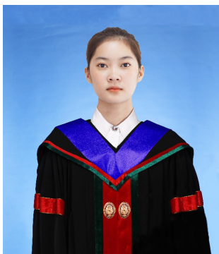
พยาบาลศาสตรบัณฑิต (พย.บ.) สีนํ้าเงิน